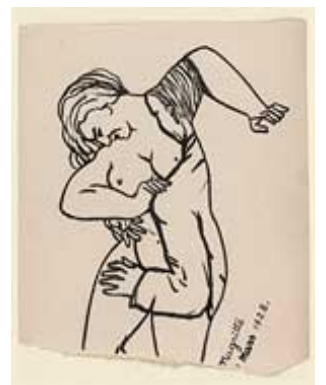
L'Aube désarmée, 1928

9/ Peignez un objet sur un support inhabituel